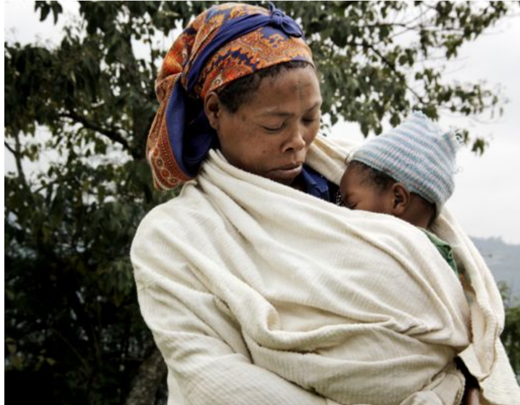
FARLEG MODERSKAP: Denne kvinna i Kemba ventar på behandling for barnet sitt på sjukehuset. I Etiopia dør nærare åtte prosent av mødrene under fødselen.