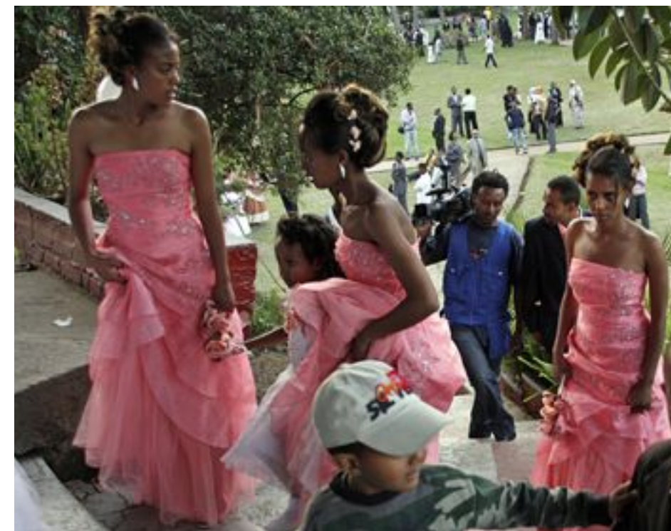
LANGT FRÅ LIKESTILTE: Brudepiker frå massebryllup i hagen til Ghion Hotel i Addis Abeba.

Den venta veksten i etiopisk økonomi vil i 2010 vere på 7 prosent. Framleis er landet ranka som nummer 171 på FNs Human development index. Av dei drøyt 90 millionane i Etiopia lever 80 prosent i fattigdom, gjennomsnittleg månadsløn er 1000 birr, om lag 500 kroner, men mange har langt mindre enn dette.