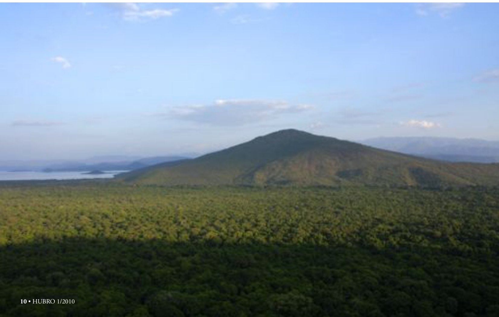
NATURSKJØNT: Byen Arba Minch ligg med utsikt over Lake Abaya (som er raud) og Lake Chano (som er blå). Dei to innsjøane er delt av fjellet «God's Bridge».

På verandaen på Paradise Lodge sit unge etiopiarar og ser sola gå ned over fjellet «God's Bridge». Nattelydane frå regnskogen blandar seg med den etiopiske musikken, og dei unge har det ikkje travelt. Dei tilhøyrer eit land i raskt vekst og med ei historie for å stå på egne bein. Framtida kan berre bli betre. ■