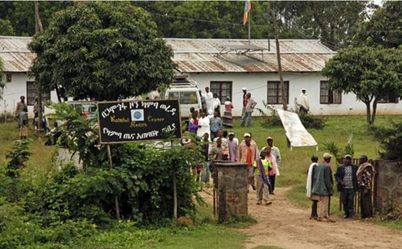
HØGFJELLS-SJUKEHUS: Det er farleg å bli sjuk i dei sør-etioopiske fjella. Legemangel og lange avstandar gjer at mange døyr av sjukdommar som kunne vore enkle å kurere.